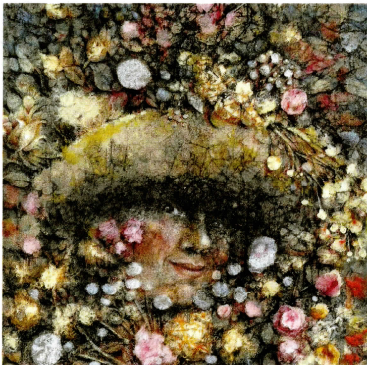
AUTOPORTRÉT. Autoportrét rožnovské výtvarnice Ludmily Vaškové (výřez z obrazu Sbírání v zahradě, 2018).

Přehledný rozvrh exponátů dle jednotlivých výtvarných druhů, kterým se autorka věnuje, poskytuje návštěvníkům