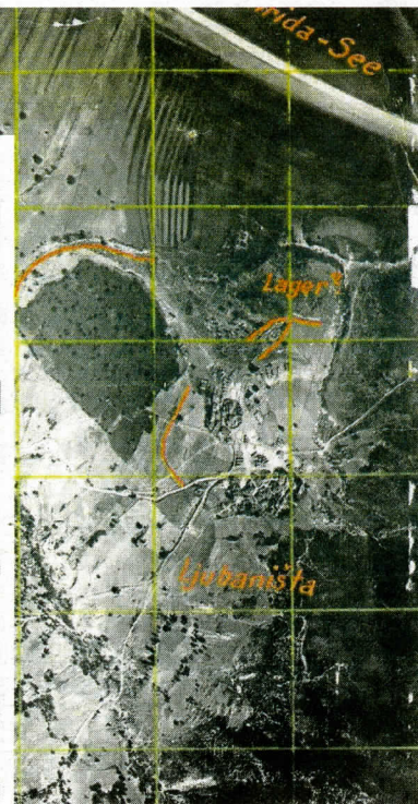
POPSANÝ SNÍMEK. Letecký snímek se zakreslenými objekty.